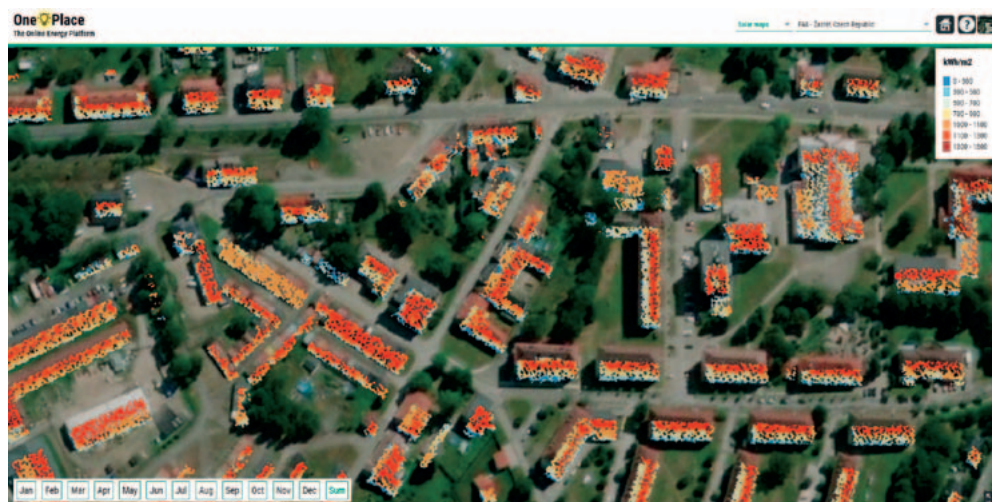
Město Žacléř – potenciál solární energie