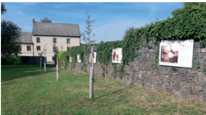
Mikroprojekt č. CZ.11.4.120/0.0/0.0/16_008/0001818 Název projektu: „Ovoce polsko-české spolupráce“ Žadatel: město Lanškroun Partner projektu: Gmina Miejska Dzierżoniów

V rámci realizace projektu se v Ząbkowicích Śląských konaly společné koncerty dechových orchestrů z partnerských měst, divadelní představení, volejbalové a fotbalové turnaje pro děti.