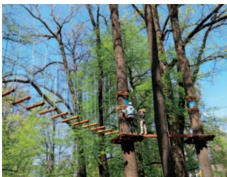
Lanová stezka a kajakářská trasa