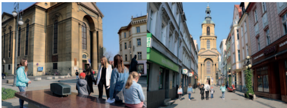
Dračí stezka (trakt smoka)

KOSTEL SV. JIŘÍ DZIERŻONIOW – nejstarší zmínka pochází z r. 1258. Je to nejstarší historická budova ve městě.