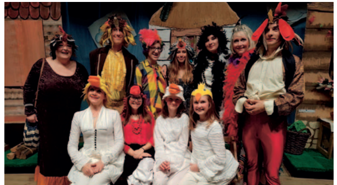
Mikroprojekt č. CZ.11.4.120/0.0/0.0/16_008/0001807 Název projektu: „Sport a kultura nás baví“ Žadatel: Gmina Ząbkowice Śląskie Partner projektu: město Červený Kostelec

Projekt podpořil tvorbu regionálních autorů. Uskutečnil se workshop pro začínající autory – spisovatele a ilustrátory z české a z polské strany, dále byly vydány dvě knížky českého a polského autora s dvoujazyčným textem. Výsledkem projektu byla následná prezentace knížek při literárních setkáních se čtenáři knihoven na české i polské straně v Polici nad Metují a ve Świdnicy.