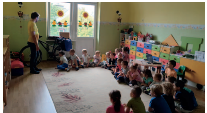
Mikroprojekt č. CZ.11.4.120/0.0/0.0/16_008/0001787 Název projektu: „S kolem jsme kamarádi“ Žadatel: Městská obec Klodzko Partner projektu: město Česká Skalice

Projekt byl spojen s jubileem 20leté spolupráce mezi Dzierżoniowem a Lanškrounem. V rámci oslav česko-polské spolupráce se konaly společenské a kulturní akce. Pro připomenutí spolupráce bylo v Lanškrouně otevřeno zákoutí s ovocnými stromy jako symbol plodné a efektivní spolupráce obou měst.