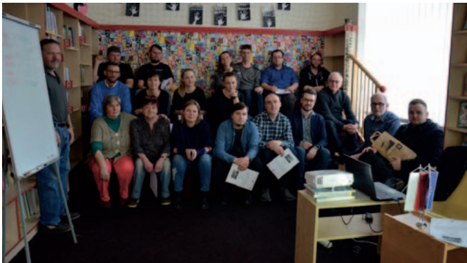
Mikroprojekt č. CZ.11.4.120/0.0/0.0/16_008/0001774 Název projektu: „Slovem i obrazem“ Žadatel: Knihovna města Police nad Metují Partner projektu: Miejska Biblioteka Publiczna im. Cypriana Kamila Norwida w Świdnicy

Projekt podpořil tvorbu regionálních autorů. Uskutečnil se workshop pro začínající autory – spisovatele a ilustrátory z české a z polské strany, dále byly vydány dvě knížky českého a polského autora s dvoujazyčným textem. Výsledkem projektu byla následná prezentace knížek při literárních setkáních se čtenáři knihoven na české i polské straně v Polici nad Metují a ve Świdnicy.