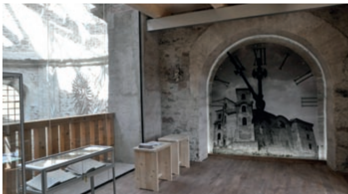
Mikroprojekt CZ.11.2.45/0.0/0.0/16_008/0000747 „Víra nás spojuje / Łączy nas wiara“ Vedoucí partner: Římskokatolická farnost Neratov Partner projektu: Rzymskokatolicka Parafia pw. Wniebowzięcia NMP w Kamieńcu Ząbkowickim