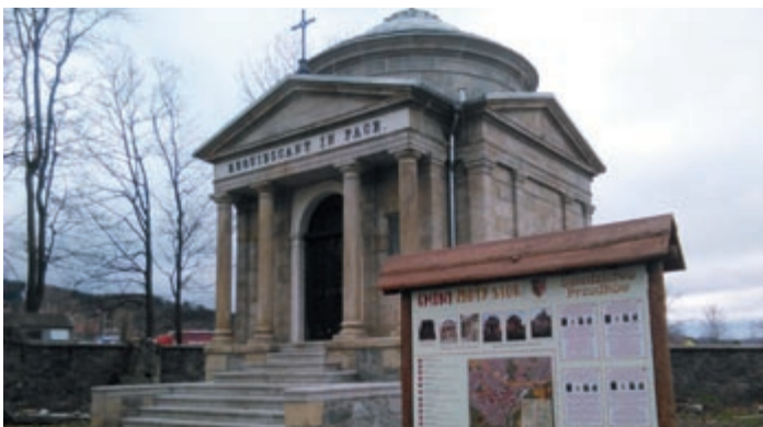
Mikroprojekt č. CZ.11.2.45/0.0/0.0/16_008/0000388 s názvem „Dědictví předků“ Příjemce: Gmina Złoty Stok • Projektový partner: Obec Bílá Voda V rámci projektu proběhla rekonstrukce chátrající památky – mauzoleum Guttlerů, která byla začleněna do Městské turistické trasy ve Zlotej Stoku, a byla postavena informační tabule.

Vydává Euroregion Pomezí Čech, Moravy a Kladska – Euroregion Glacensis, Panská 1492, 516 01 Rychnov nad Kněžnou, Česká republika ve spolupráci se Stowarzyszeniem Gmin Polskich Euroregionu Glacensis, Łukasiewicza 4a/2, 57-300 Kłodzko, Polsko