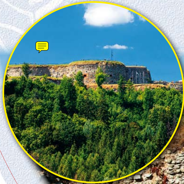
Pevnost Srebrna Góra, Stoszowice / Twierdza Srebrna Góra, Stoszowice