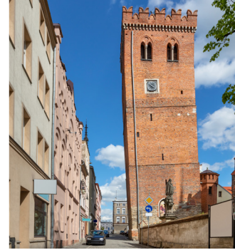
Bazylika w Bardzie / Bazylika w Bardzie (fot. N. Kochanek) Most w Bardzie / Most w Bardzie (fot. N. Kochanek)