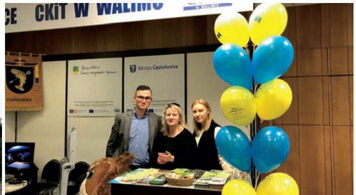
Mikroprojekt č. CZ.11.2.45/0.0/0.0/16_008/0000742 „Walim a Častolovice - polsko-česká spolupráce pro rozvoj turistiky“. Vedoucí partner: Kulturní a turistické centrum Walim · Partner projektu: městy Častolovice

Vydává Euroregion Pomezí Čech, Moravy a Kladska – Euroregion Glacensis, Panská 1492, 516 01 Rychnov nad Kněžnou, Česká republika ve spolupráci se Stowarzyszeniem Gmin Polskich Euroregionu Glacensis, Łukasiewicza 4a/2, 57-300 Kłodzko, Polsko