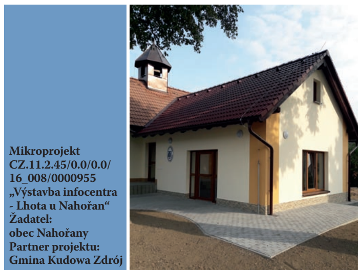
Mikroprojekt CZ.11.2.45/0.0/0.0/ 16_008/0000955 „Výstavba infocentra - Lhota u Nahořan“ Žadatel: obec Nahořany Partner projektu: Gmina Kudowa Zdrój