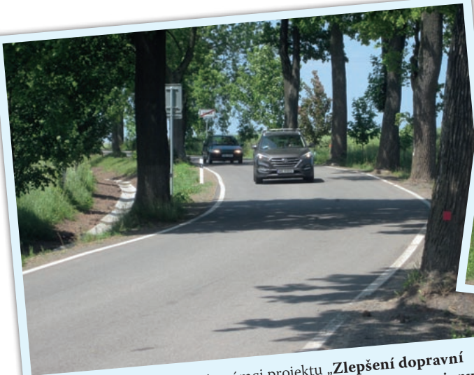
Královéhradecký kraj v rámci projektu „Zlepšení dopravní dostupnosti Broumovska a Kladsko – valbříšského regionu“ provedl rekonstrukci silnice III/3025 Broumov – Božanov st. hranice.