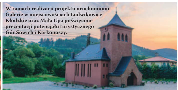
W ramach realizacji projektu uruchomiono Galerie w miejscowościach Ludwikowice Kłodzkie oraz Mała Upa poświęcone prezentacji potencjału turystycznego Gór Sowich i Karkonoszy.