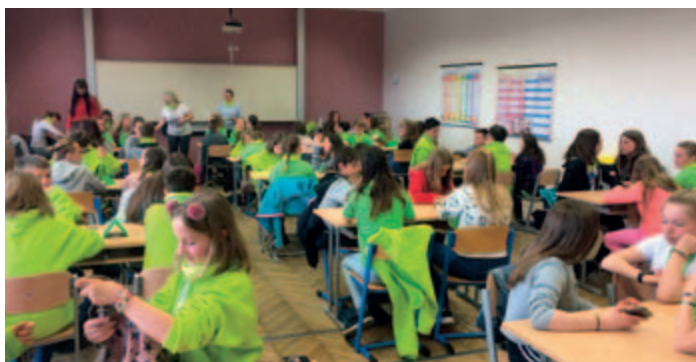
Mikroprojekt nr CZ.11.4.120/0.0/0.0/16_008/0001414 Tytuł projektu: Tu i tam przyjaciół mam II Wnioskodawca: Město Kopidno Partner projektu: Gmina Świdnica