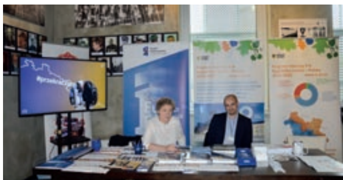
10. 5. 2019 Dny otevřených dveří Evropských fondů, Vědecké a umělecké centrum Stara Kopalnia

Zvláštní pozornost byla věnována prioritní ose 3 programu Vzdělávání a kvalifikace, která umožňuje realizaci projektů zaměřených na společné aktivity v oblasti vzdělávání a zvyšování kvalifikací absolventů, spolupráci mezi vzdělávacími subjekty a institucemi trhu práce, a také jazykové vzdělávání v rámci školského systému.