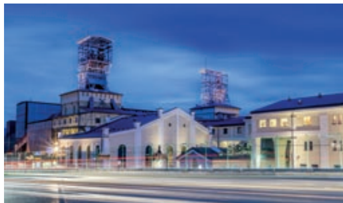
Regionální kontaktní místo ve Valbřichu, Vědecké a umělecké centrum Stara Kopalnia

Realizace projektu umožnila studentům zdravotnických oborů partnerských škol zvýšit jejich odborné kvalifikace díky účasti v zahraničních stážích ve zdravotnických a ošetrovatelských zařízeních a na workshopech zaměřených na komparaci systémů zdravotní