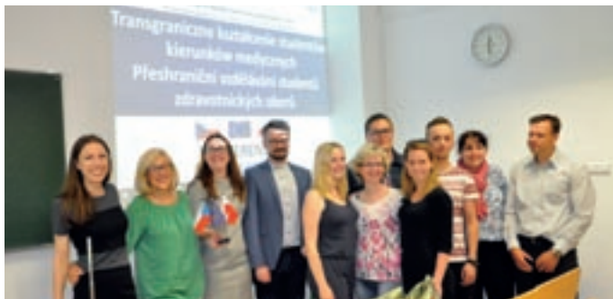
Účastníci projektu: Přeshraniční vzdělávání studentů zdravotnických oborů.

V rámci projektu se studenti zdravotnických oborů partnerských škol účastnili na obou stranách společně realizovaných zahraničních stáží ve zdravotnických a ošetrovatelských zařízeních, výjezdových