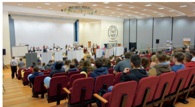
03. 04. 2019 Wiosenne Targi Pracy i Edukacji IN FUTURE. Karkonoska Państwowa Szkoła Wyższa w Jeleniej Górze

Na zaproszenie Karkonoskiej Państwowej Szkoły Wyższej w Jeleniej Górze Regionalny Punkt Kontaktowy uczestniczył w Wiosennych Targach Pracy i Edukacji IN FUTURE w dniu 3 kwietnia 2019 r., a w dniu 11 kwietnia 2019 r. na zaproszenie Państwowej Wyższej Szkoły Zawodowej im. Angelusa Silesiusa w Wałbrzychu w targach pracy, praktyk i staży w ramach Dnia Kariery PWSZ w Wałbrzychu. Podczas Wiosennych Targów Pracy i Edukacji IN FUTURE wystawcy z polsko-czesko-niemieckiego pogranicza mieli możliwość zaprezentowania swoich firm i instytucji oraz zachęcenia młodzieży