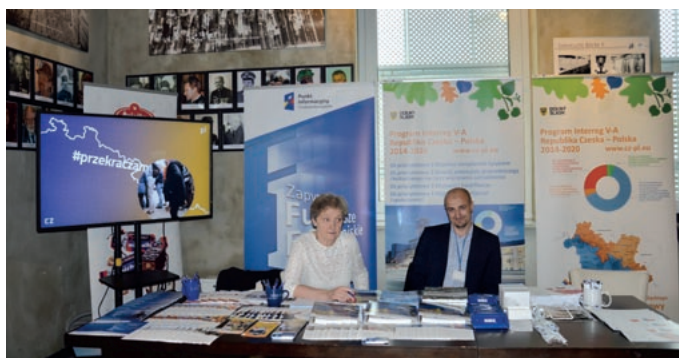
10. 05. 2019 Dni Otwarte Funduszy Europejskich w Centrum Nauki i Sztuki Stara Kopalnia, (zdjęcia nr 6 i 6A)

W dniu 16 kwietnia 2019 r. w Instytucie Filologii Słowiańskiej Uniwersytetu Wrocławskiego pracownicy RPK w Wałbrzychu spotkali się ze studentami filologii czeskiej Uniwersytetu Wrocławskiego. Podczas spotkania studenci mogli uzyskać podstawowe informacje o Programie, zasadach przygotowania propozycji projektowych w aktualnym naborze na projekty edukacyjne, poznać specyfikę projektów transgranicznych oraz zapoznać się z wybranymi projektami realizowanymi w ramach Programu w różnych obszarach współpracy polsko-czeskiej. Poruszono także możliwości przyszłego wykorzystania kompetencji językowych studentów i absolwentów bohemistyki w ramach realizowanych projektów. Szczególną uwagę poświęcono osi priorytetowej 3 Programu Edukacja i kwalifikacje, która stwarza możliwość realizacji projektów w zakresie wspólnych działań w obszarze kształcenia i podnoszenia kwalifikacji absolwentów, współpracy pomiędzy instytucjami edukacyjnymi a instytucjami rynku pracy, jak również kształcenia językowego w ramach systemu oświaty.