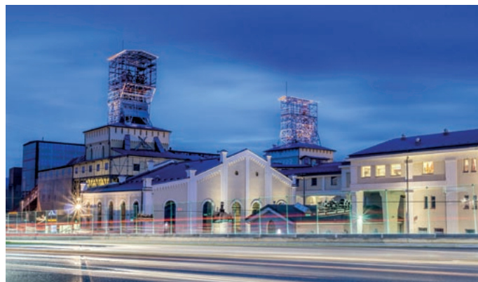
Regionalny Punkt Kontaktowy w Wałbrzychu z siedzibą w Centrum Nauki i Sztuki Stara Kopalnia, źródło: Stara Kopalnia.

Realizacja projektu umożliwiła studentom kierunków medycznych zaprzyjaźnionych uczelni na podniesienie swoich kwalifikacji zawodowych poprzez udział w stażach zagranicznych w instytucjach służby zdrowia i opieki społecznej czy wyjazdowych warsztatach porównawczych systemów opieki zdrowotnej. Niezaprzeczną wartością dodaną projektu