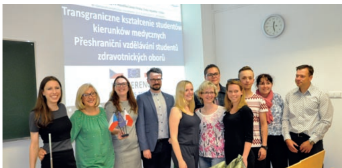
Uczestnicy projektu: Transgraniczne kształcenie studentów kierunków medycznych, źródło: Karkonoska Państwowa Szkoła Wyższa w Jeleniej Górze.

W ramach projektu studenci kierunków medycznych partnerskich uczelni uczestniczyli w przeprowadzanych wspólnie po obu stronach