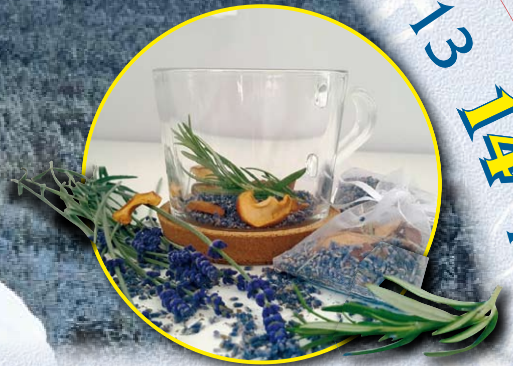
Woliborska Herbata Lawendowa , (Levandulový čaj z Woliborze), Dom Pod Lawendowym Polem, Wolibórz, gmina Nowa Ruda