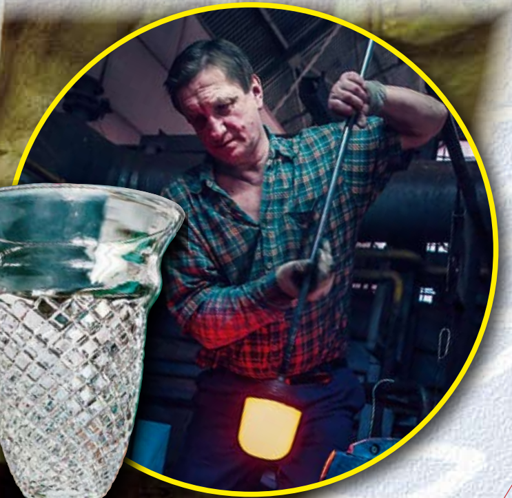
Szkło kryształowe (Křišťálové sklo), Huta Szklá Kryształowego „Violetta“, Grupa Kapitałowa MINEX, Stronie Śląskie