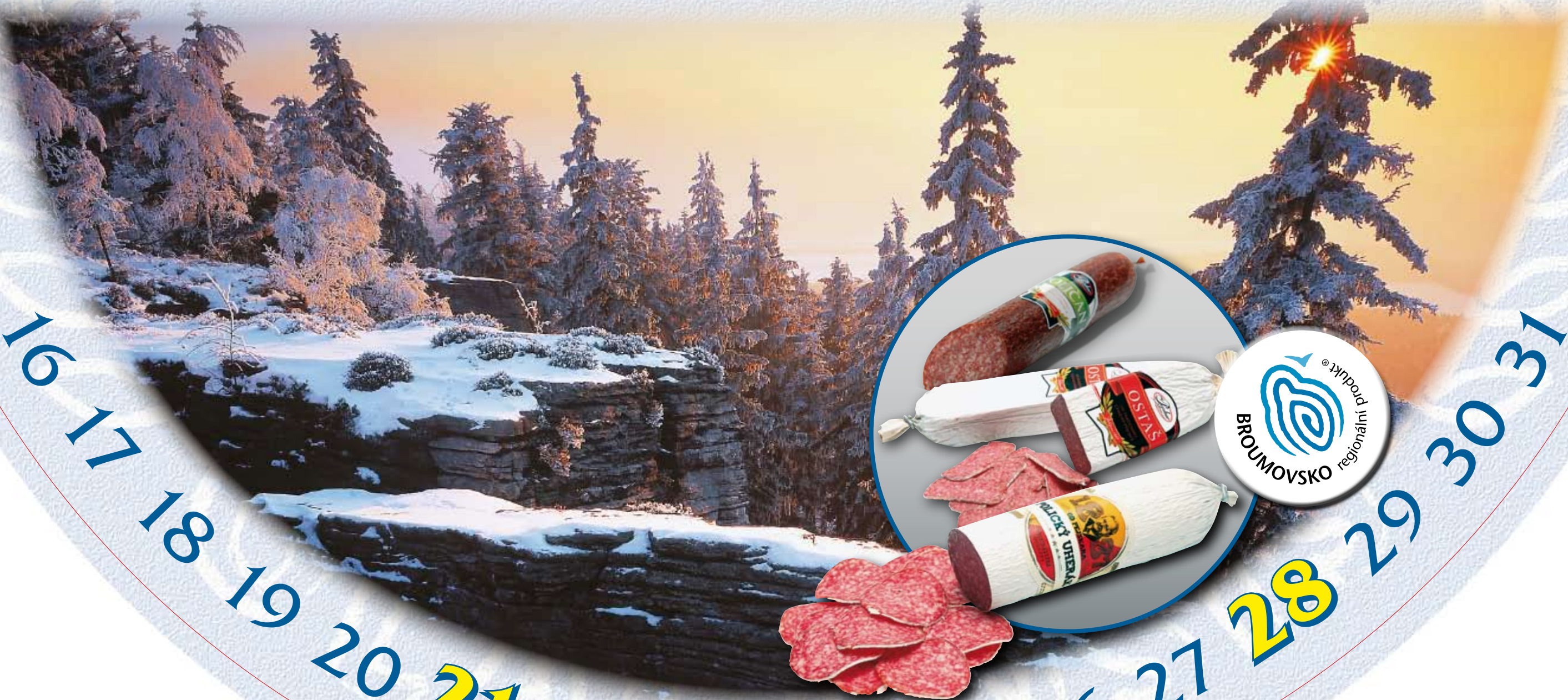
Poličan, Polický uherák, Ostaš , (Kielbasy Poličan, Polický uherák, Ostaš), Pejskar a spol. s r.o., město Police nad Metují

16 17 18 19 20 21 22 23 24 25 26 27 28 29 30 31