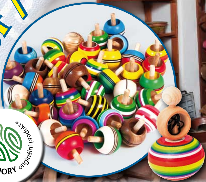
Dřevěné hračky (Drewniane zabawki), Karel Jirsa, město Dobruška