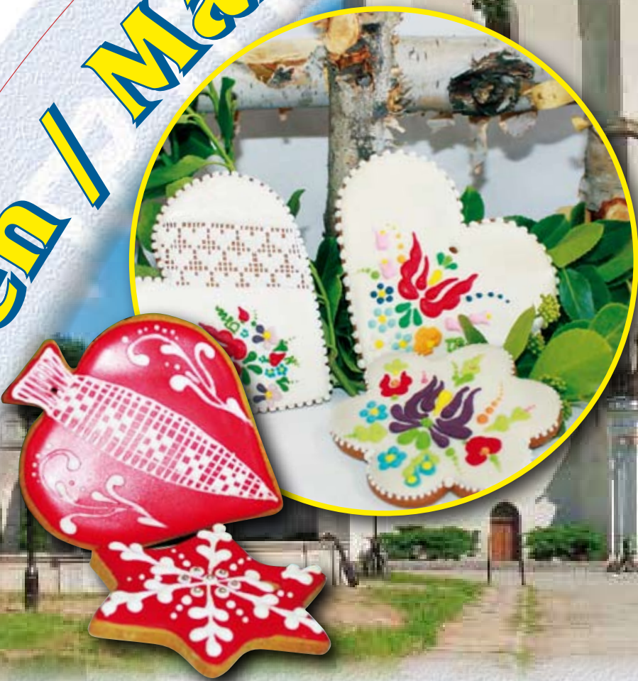
Pierniczki ze szlaku cystersów (Perníčky z cisterciácké stezky), Elżbieta Malinowska, Ciepłowody