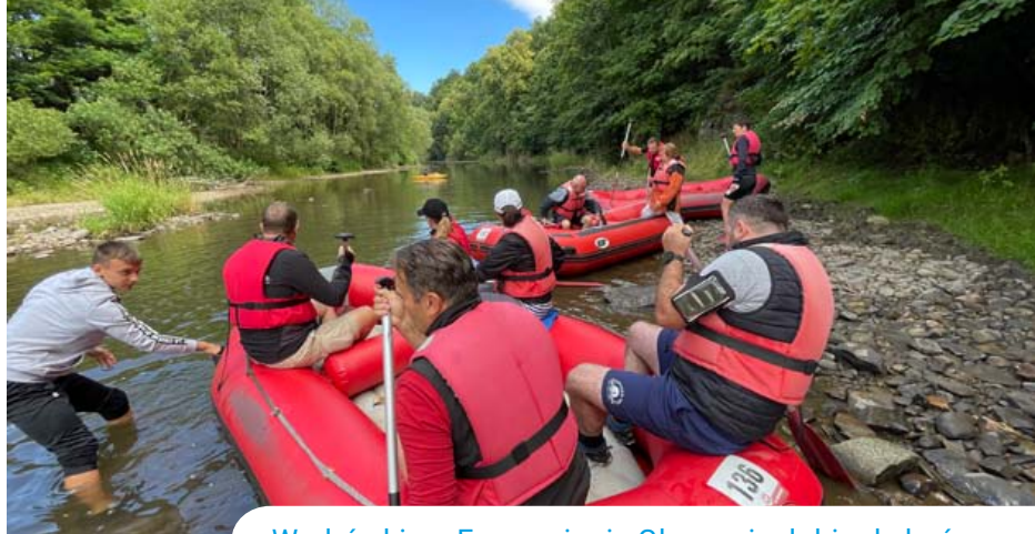
Wędrówki po Euroregionie Glacensis dobiegły końca