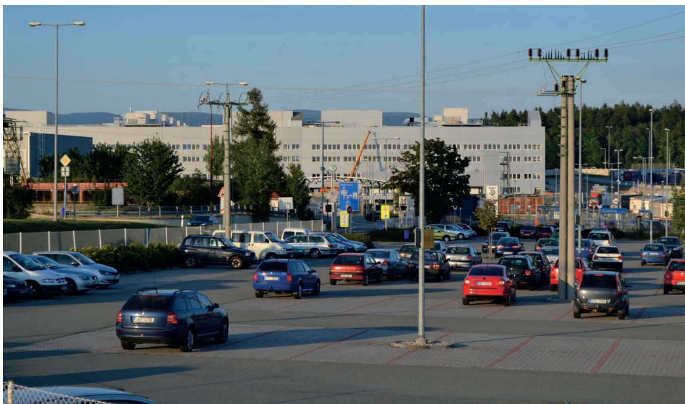
Do ważnych branż wymiany handlowej należy przemysł motoryzacyjny. Zdjęcie zakładów Skoda Auto Kvasiny.

Mówimy tu o tzw. strukturze rodzajowej wymiany handlowej z Polską. Widoczne jest, że struktura towarów jest w analizowanym okresie mniej więcej stała.