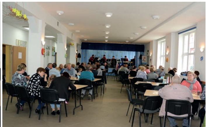
Mikroprojekt CZ.11.4.120/0.0/0.0/16_008/0000367 pn. „Przyjaźń bez granic“, Gmina Kondratowice - „prezentacja czeskiej kuchni w Kondratowicach“

Wydawca Euroregion Pomezi Čech, Moravy a Kladská – Euroregion Glacensis, Panská 1492, 516 01 Rychnov nad Kněžnou, Republika Czeska w współpracy ze Stowarzyszeniem Gmin Polskich Euroregionu Glacensis, Łukasiewiczza 4a/2, 57-300 Kłodzko, Polska