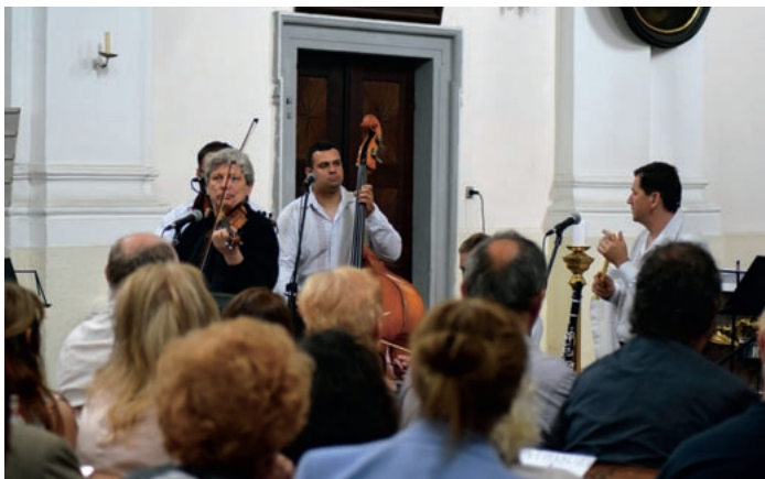
Mikroprojekt CZ.11.4.120/0.0/0.0/16_008/0000722 pn. „Muzyka z zapachem tulipanów“, Gmina Bilá Voda - „koncert w ramach Festiwalu Muzyki Duchownej im. Brossmanna“