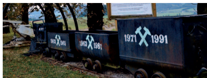
Terénní důlní expozice – volně přístupná

Při cestě zpět si v naší obci ještě prohlédnete zajímavou terénní expozici důlních strojů, dědičnou štolu Kateřina a Muzeum vojenské historie.