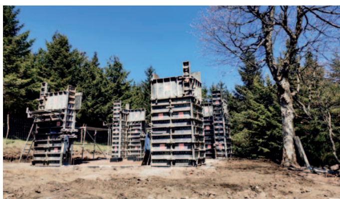
Stavba rozhledny na Vrchmezi