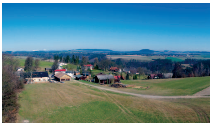
Výhled z rozhledny Vysoká Srbská