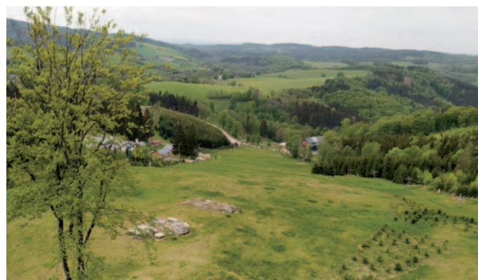
Výhled z rozhledny Olešnice v Orlických horách

Na dalších místech jsou stavební práce v plném proudu. Buduje se na Kladské hoře, Vrchmezi, Czerniecu, na hoře sv. Anny u Nové Rudy, Šibeníku u Nového Hrádku i v Neratově. Dokonce roku by