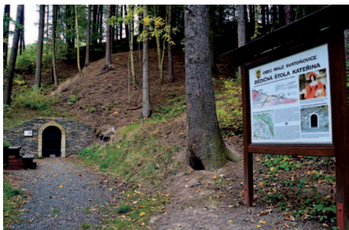
Dědičná štola Kateřina