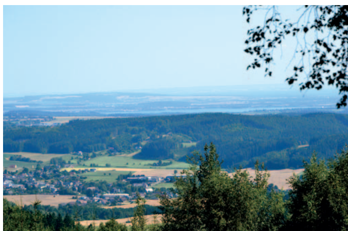
Výhledy při výstupu na vrchol Žaltman, Jestřebí hory