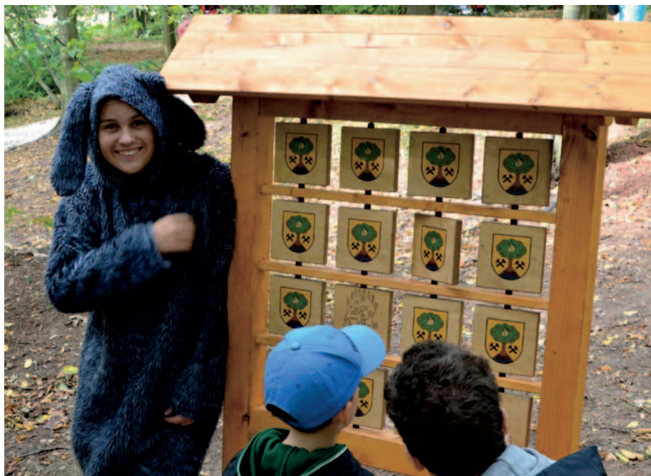
Interaktivní tabule v parku lákají nejen malé turisty