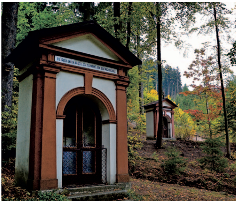
Kapličky v Mariánském sadě