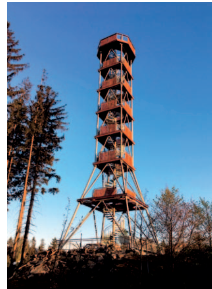
Olešnice v Orlických horách – rozhledna OTEVŘENA