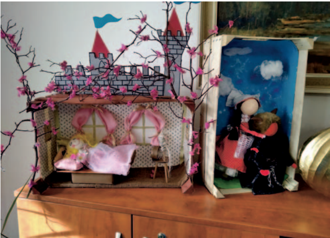
Pohádky v bedýnkách

zachycuje příběh života potomků Boženy Němcové prostřednictvím fotografií, korespondence, dobových dokumentů a knih. Nechybí ani vzácné trojrozměrné předměty z 19. století.