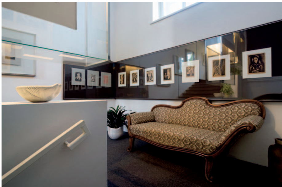
Muzeum bratří Čapků – interiér