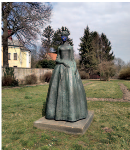
Roušku proti koronaviru dostala i socha spisovatelky

Březnový až květnový program Roku Boženy Němcové zhatil koronavirus a nemoc COVID-19. Zrušeny byly i některé červnové akce. Přesto pracovníci odboru kultury Městského úřadu v České Skalici nezháleli a připravili v průběhu dubna a kvě-