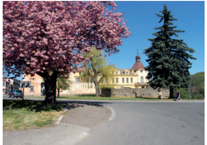
Muzeum Boženy Němcové

Ve dnech 4. až 6. září 2020 se uskuteční tradiční výstava jiřinek v prostorách maloska-