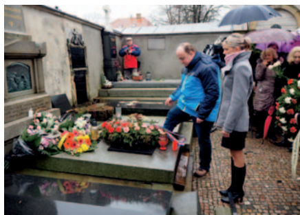
Kladení věnců na Vyšehradě

V úterý 4. února uspořádalo město Česká Skalice ve spolupráci se Společností Boženy Němcové autobusový zájezd do Prahy k hrobu spisovatelky. Z vyšehradského hřbitova vysílala přímý přenos Česká televize.