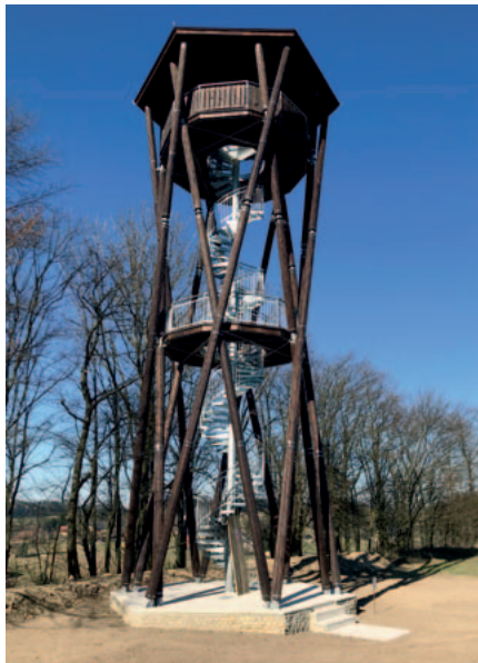
Vysoká Srbská – rozhledna OTEVŘENA

Druhou dokončenou stavbou je od 30. května také rozhledna na Feistově kopci nad Olešnicí v Orlických horách. Věž vysoká 26 metrů stojí v bezprostřední blízkosti Naučné geologické stezky, naučné stezky Po lehkém opevnění a Jiráskovy trasy.