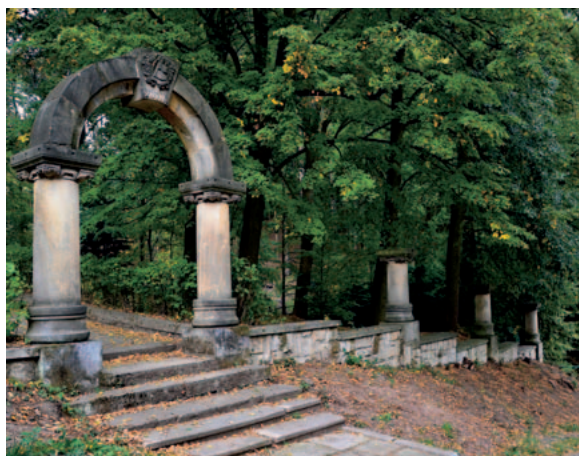
Vstup do Mariánského sadu

Z parku se dostanete do Mariánského sadu s kapličkami, kde si můžete projít křížovou cestu na jejímž konci je kapele Božího hrobu s uloženou sochou Krista (z roku 1906) z alabastru. Socha je zhotovená sochařem Antonínem Suchardou z Nové Paky a uložena je na kamenném lůžku z araukaritů.