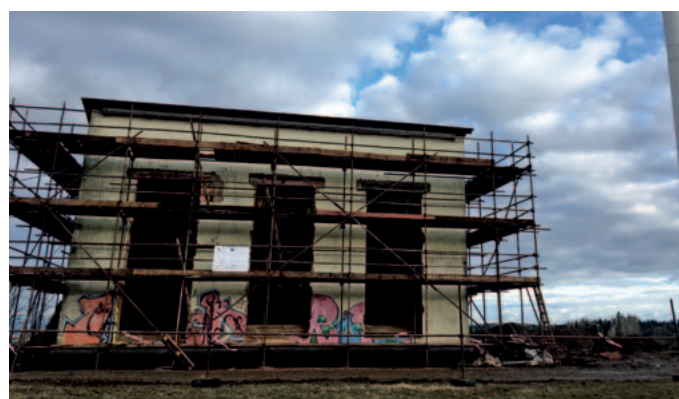
Výstavba infocentra na Šibeníku v Novém Hrádku