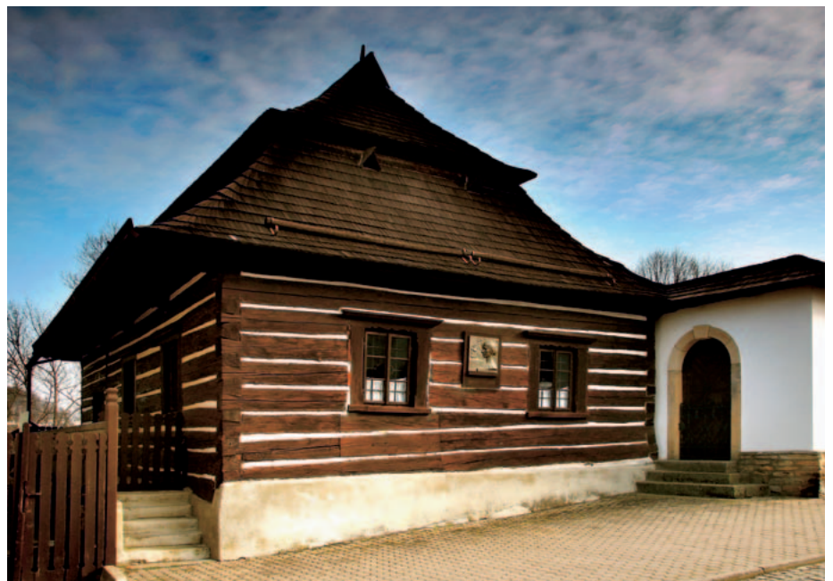
Barunčina škola v České Skalici

lické tvrže a na políčkách v areálu Muzea Boženy Němcové. V pátek a sobotu 4. a 5. září do České Skalice zavítá Kino na kolečkách. Stane se tak na louce pod muzeem, kde se bude promítat film Babička. A v rámci výstavy jiřinek by se měl uskutečnit také „Salón český obrozenecký“ v podání Folklorního souboru Barunka z České Skalice. Rok Boženy Němcové by měl 21. listopadu 2020 zakončit stejnojmenný ples v českoskalické sokolovně, na který vás zveme. Jeho program a předprodej vstupenek včas oznámíme.