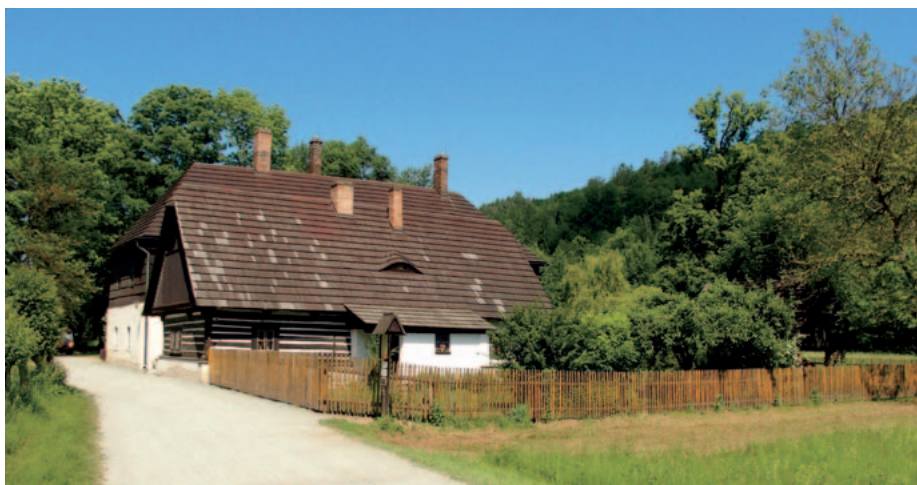
Staré bělidlo v Ratibořicích – foto Jan Holý

Velmi nepříjemné počasí, které doprovázelo dopolední pietní akt se po obědě zlepšilo, takže přesun do Památníku národního písemnictví byl příjemnou procházkou. Zde se uskutečnila konference o životě a díle Boženy Němcové v širších souvislostech.