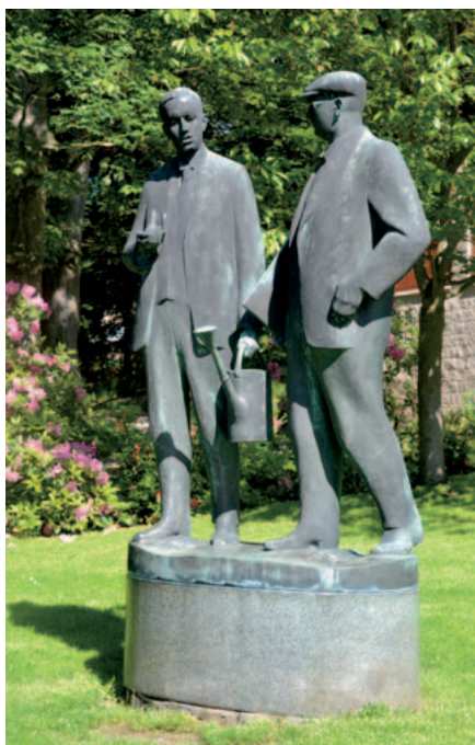
Sousoší bratří Čapků z náměstí Karla Čapka

V expozici Josefa Čapka představujeme výtvarné dílo tohoto umělce, dvacet originálních olejomalb, které jsou průřezem od počátku jeho tvorby až po závěrečná protifašisticky laděná díla. Seznámíte se také s životopisnými daty a rodinnými fotografiemi.